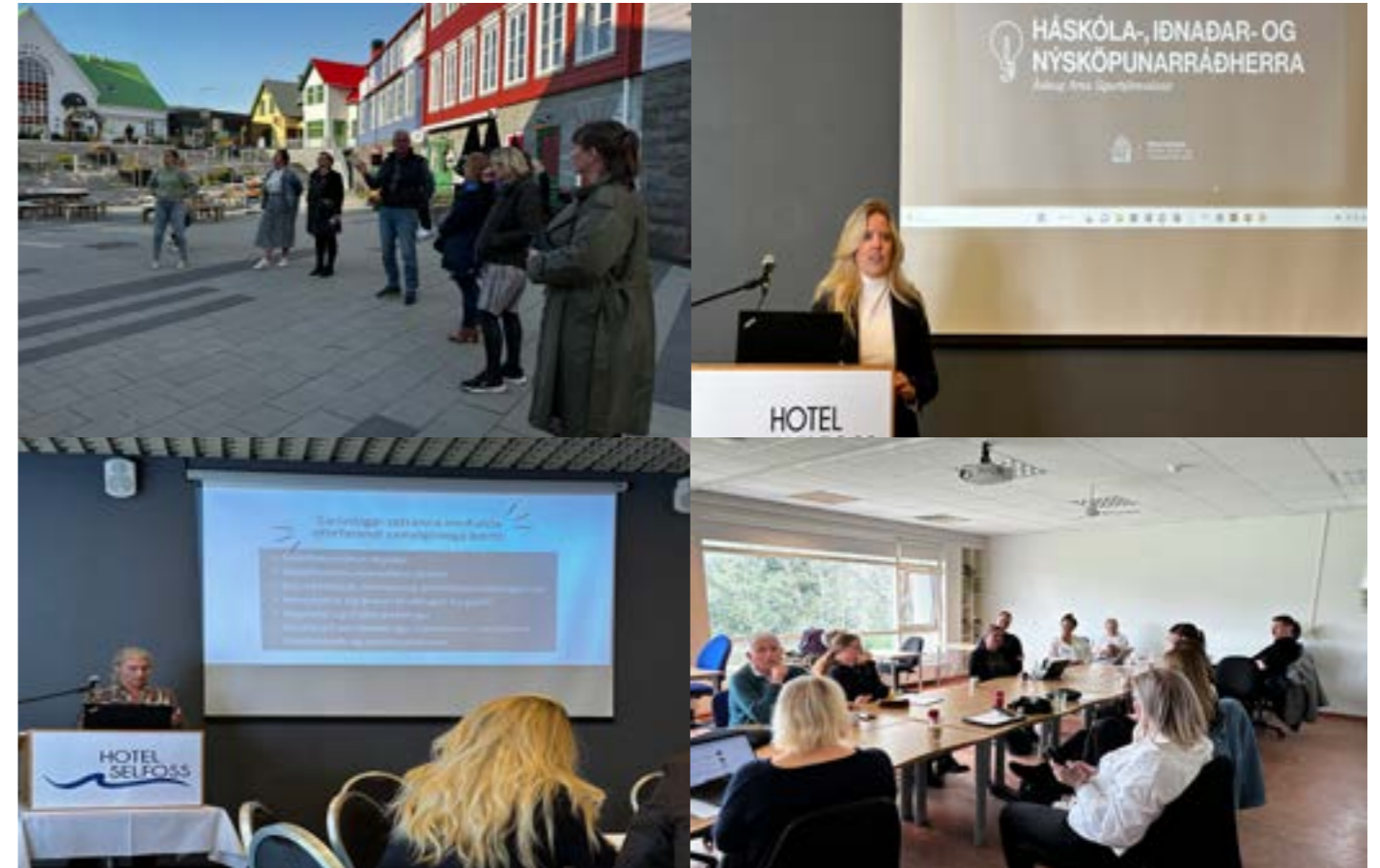
Myndir frá ársfundi SPS