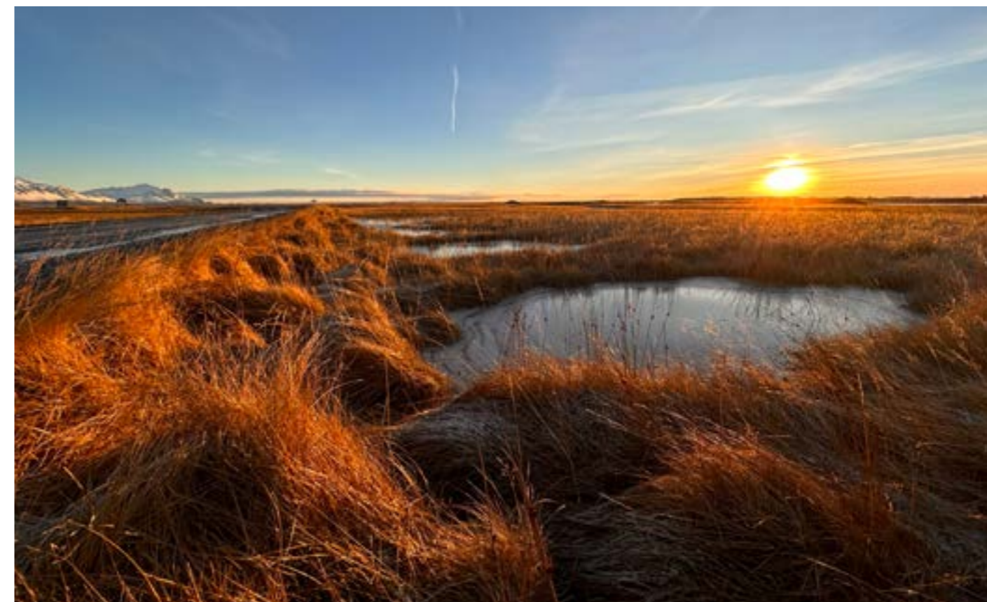
Á Mýrum

Huguín Harpa Reynisdóttir Forstöðumaður, 27. mars 2024