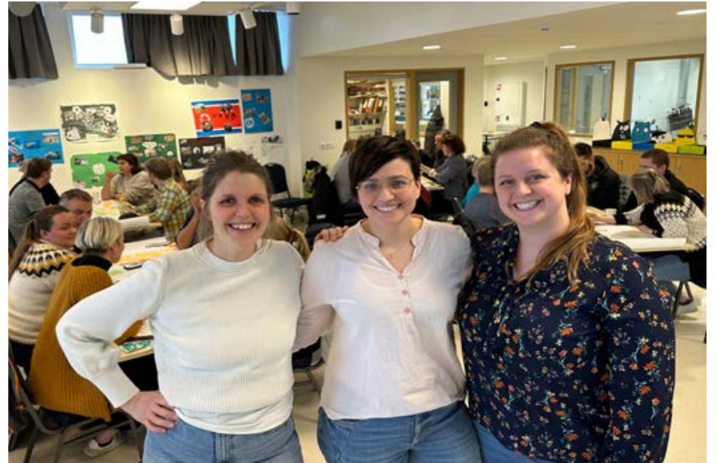
Verkefnastjórar á vinnufundi starfsmanna sveitarfélagsins í Vöruhúsinu, mynd óþk.

Meðal fyrstu verkefna hópsins er að rýna sérsvið stofnana á svæðinu og möguleika innan fyrirtækja til rannsóknaverkefna. Lögð verður áhersla á að miðla þeim tækifærum sem eru á svæðinu meðal háskólanema í samstarfi við háskóla landsins. Auk þekkingarsetursins standa að hópnum fulltrúar frá Náttúrustofu Suðausturlands, Háskóla Íslands, Menningarmiðstöð Hornafjarðar, Vatnajökuls-þjóðgarði og Háskólafélagi Suðurlands.