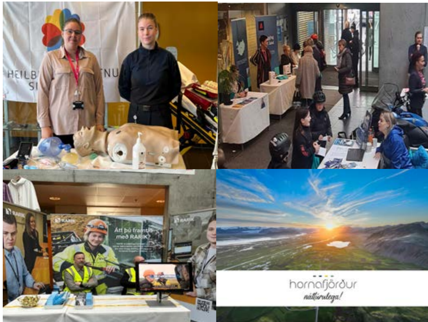
Myndir frá Starfastefnumóti 2023, myndir óþk.