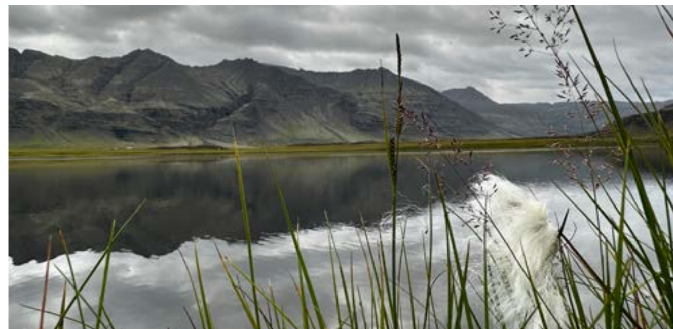
Fífutjörn í Suðursveit