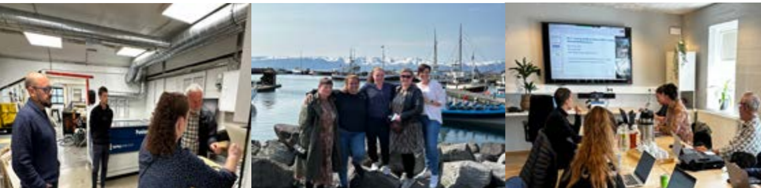
Myndir frá fundi samstarfsaðila á Húsavík sumarið 2023, myndir HHR og óþk.

Á vormánuðum komu góðir vinir og samstarfsaðilar frá Söderhamn í Svíþjóð í heimsókn en tilgangur heimsóknarinnar var undirbúningur styrkumsóknar. Á haustmánuðum hófst svo nýtt samstarf milli Nýheima, CFL í Söderhamn og Nordfjordakademiet í Noregi og er það fyrsti norræni samstarfshópur setursins. Öllu fjölbjóðlegu samstarfi fylgja verðmæt tækifæri til yfirfærslu þekkingar og erum við afar spennit fyrir hinu nýja norræna samstarfi.