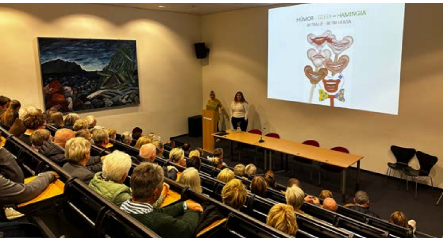
Hornafjörður, náttúrulega! erindi um húmor