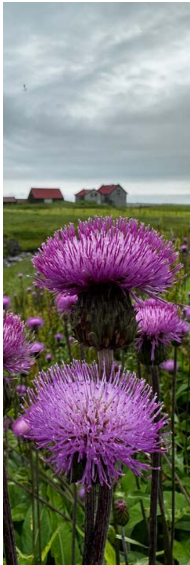
Pistill (Cirsium arvense), mynd HHR

Steinunn Hödd Harðardóttir Formaður stjórnar 27. mars 2024