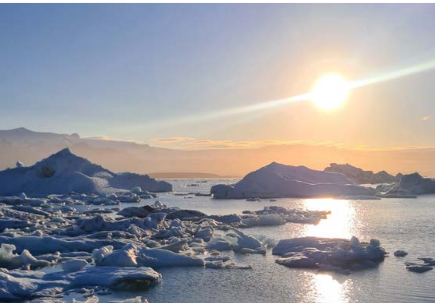
Frá Jökulsárlóni á Breiðamerkursandi