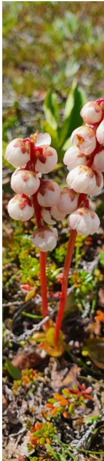
Klukkublóm (Pyrola minor)