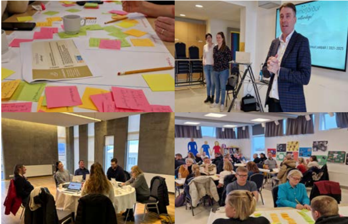
Myndir frá vinnufundum, myndir HHR og óþk.